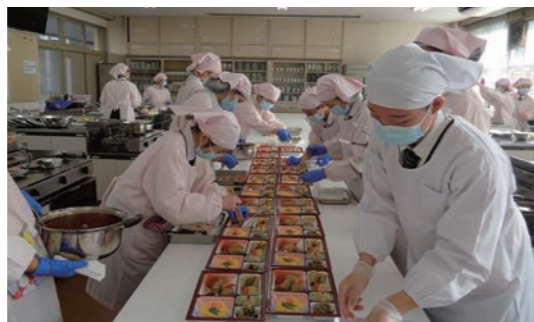
ランチサービスデー

スカイシステム（天井360度カメラ）や3Dプリンターの導入などが、校内での学びを支え、実践力を伸ばします。