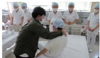
外部講師による授業