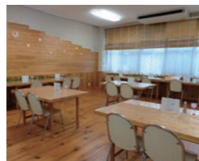
食事作法室(ナチュラル)

家政科の生徒が学習成果を披露する行事です。ファッションショーや手作りスイーツのカフェ、お菓子の販売など楽しいイベントが盛りだくさん。家政科の日は中学生も参加できますので、ぜひ来てくださいね。