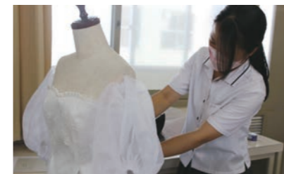
ファッションデザイン