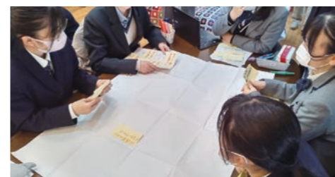
聞き書きフォーラム