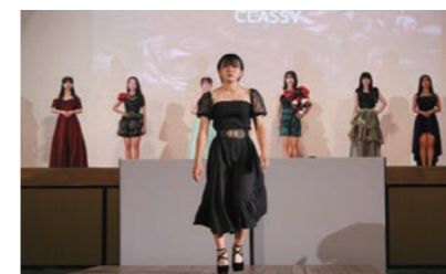
ファッション造形