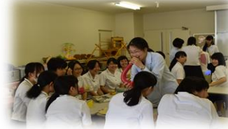
文系・生物理系2年「川崎医療福祉大学訪問」